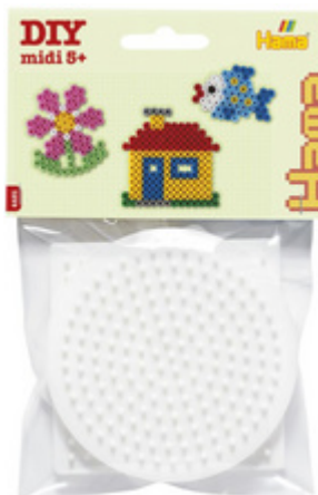
Stiftplatten midi "Quadrat, Kreis, Sechseck", im Blister

ACHTUNG! Nicht geeignet für Kinder unter 36 Monaten, wegen verschluckbarer Kleinteile.