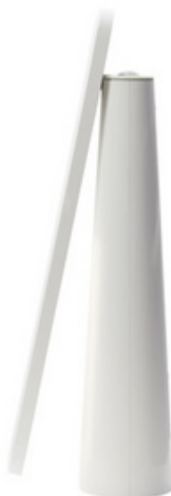
Akku LED-Tischleuchte "LEDTUBE" - eingeklappt