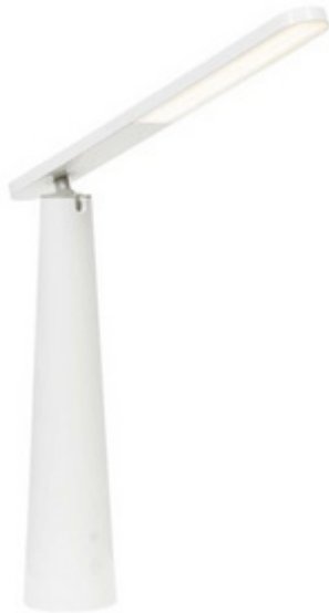
Akku LED-Tischleuchte "LEDTUBE"