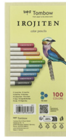
Buntstifte IROJITEN "Volumen 1", 10er Set