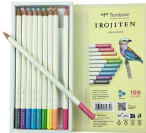
Buntstifte IROJITEN "Volumen 1", 10er Set