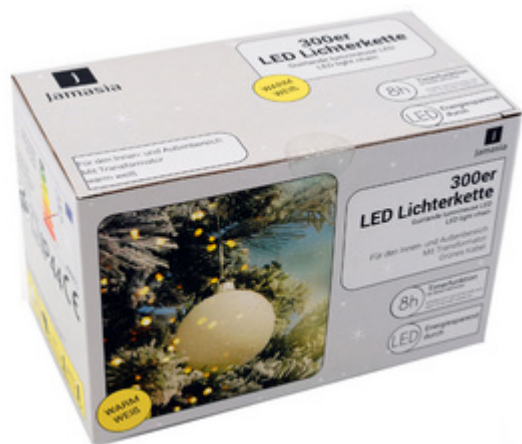
LED-Lichterkette, 300 Lichter