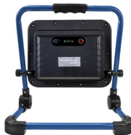
LED Akku-Arbeitsstrahler LUMINARY FL4500R, Rückansicht