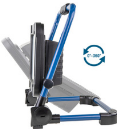
LED Akku-Arbeitsstrahler LUMINARY FL4500R, mit Verstellwinkel