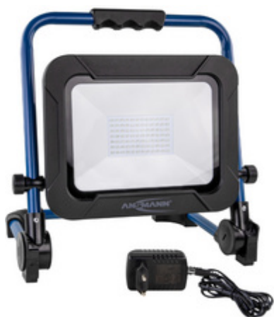
LED Akku-Arbeitsstrahler LUMINARY FL4500R