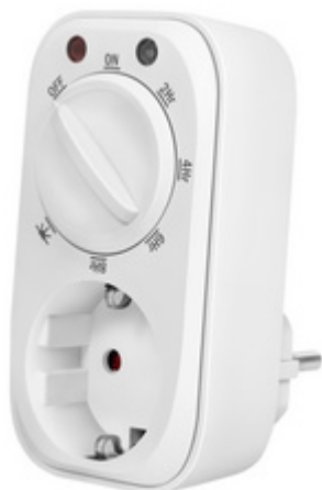
Mechanische Zeitschaltuhr mit Dämmungssensor, IP20