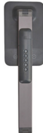
Detailansicht: zeigt die Lampe komplett zusammengeklappt