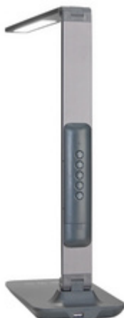
Detailansicht: zeigt die Rückseite der Leuchte