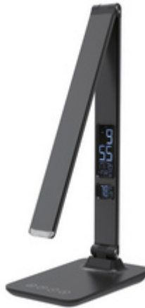
Detailansicht: zeigt das Display