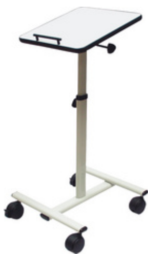
Projektionswagen EuroLine DVP I