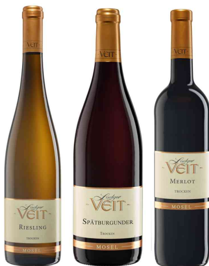
3er Weinpräsent - Riesling, Spätburgunder, Merlot

Hinweis: Design des Präsentkartons hat sich geändert! Jetzt in Naturoptik!