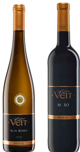
2er Weinpräsent - Alte Reben Riesling & Rotwein 30 XO

Hinweis: Design des Präsentkartons hat sich geändert! Jetzt in Natur-Braun!