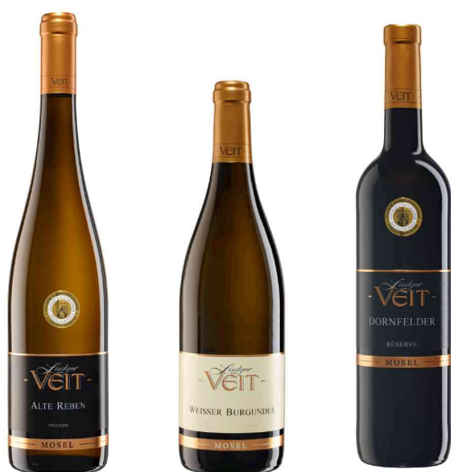
3er Weinpräsent - Riesling, Weisser Burgunder, Dornfelder Réserve

Hinweis: Design des Präsentkartons hat sich geändert! Jetzt in Naturoptik!