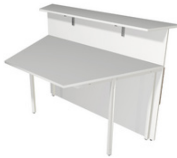
1) Theke, 2-seitig schräg