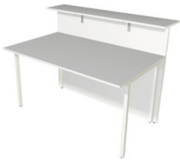
1) Theke, 2-seitig gerade