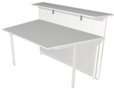
1) Theke, 1-seitig schräg