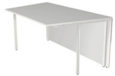
2) Tischelement, 1-seitig schräg