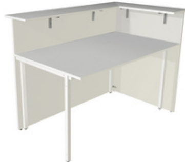
3) Ecktheke, einseitig offen