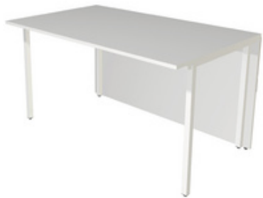
2) Tischelement, 2-seitig gerade