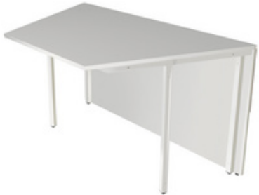
2) Tischelement, 2-seitig schräg