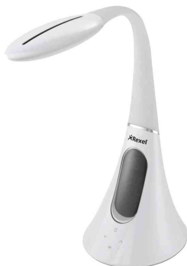
Tageslicht-Leuchte ActiVita Pod+