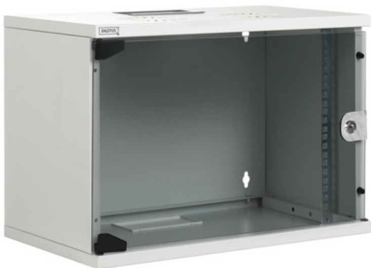
19" Wandverteilergehäuse SoHo Compact Serie, lichtgrau