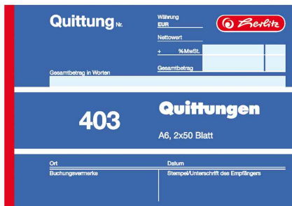
Formularbuch 403 - Quittung