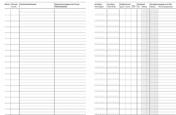
Formularbuch 602 - Fahrtenbuch, Innenansicht