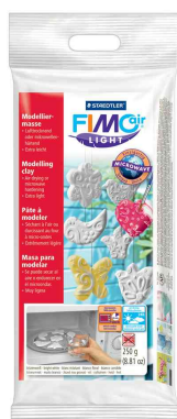
Modelliermasse, 250 g