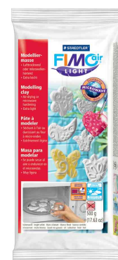
Modelliermasse, 500 g