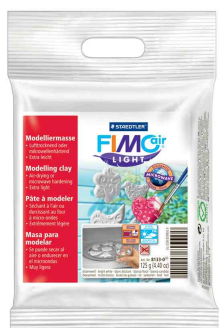
Modelliermasse, 125 g