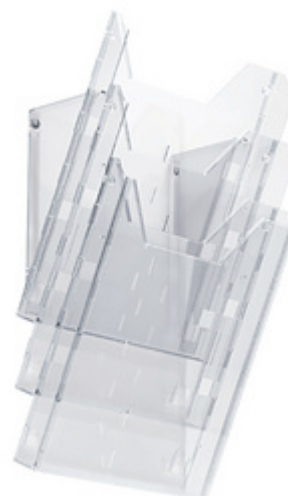
Prospekthalter-System COMBIBOXX A4 set L, Wandprospekthalter