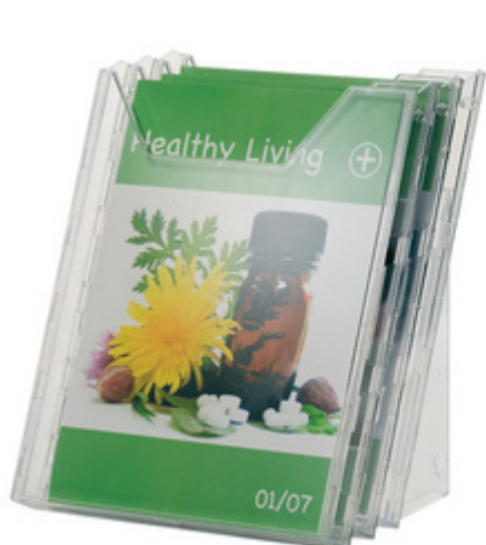
Prospekthalter-System COMBIBOXX A4 set L, Anwendungsbeispiel