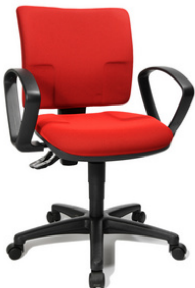
Bürodrehstuhl "U 50", rot mit optionaler Armlehne Typ B2(B)