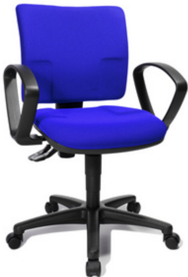
Bürodrehstuhl "U 50", blau mit optionaler Armlehne Typ B2(B)