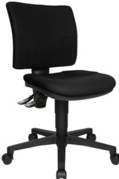
Bürodrehstuhl "U 50", schwarz