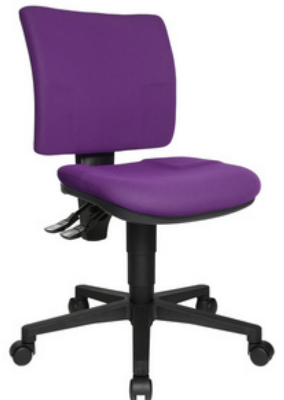
Bürodrehstuhl "U 50", violett