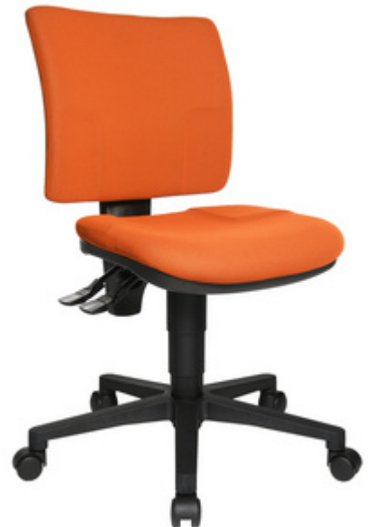
Bürodrehstuhl "U 50", orange