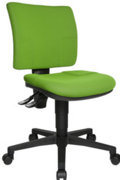
Bürodrehstuhl "U 50", grün