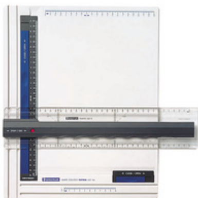
Zeichenplatte Mars, DIN A4