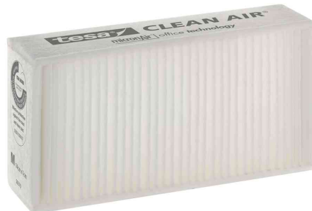
Feinstaubfilter "CLEAN AIR®", Größe M