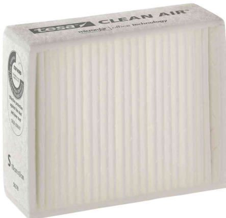
Feinstaubfilter "CLEAN AIR®", Größe S