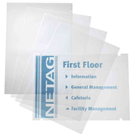
Zubehör: Folien CRYSTAL SIGN refill