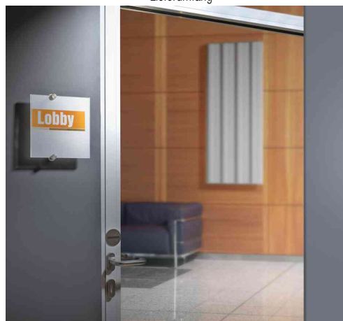
Türschild CRYSTAL SIGN, Anwendungsbeispiel