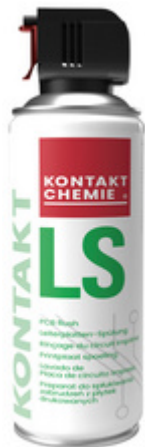
Leiterplattenspülung "KONTAKT LS"