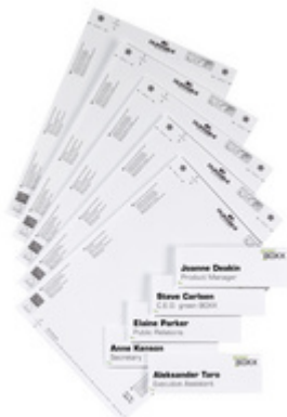
Zubehör: Einsteckschilder INFO SIGN REFILL