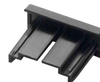
Zubehör: Kappen INFO SIGN REFILL