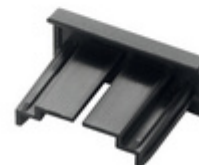
Zubehör: Kappen INFO SIGN REFILL