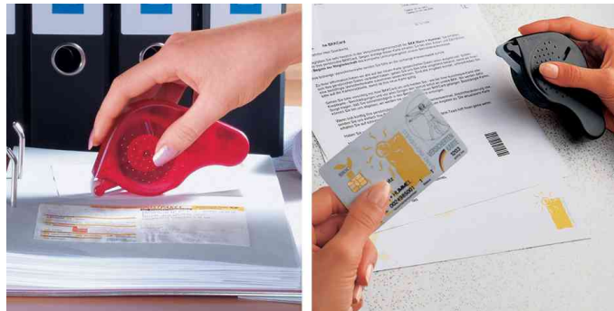
Transfer Kleberoller, Anwendung