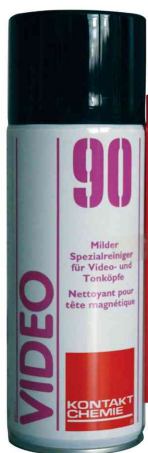
Magnetkopfreiniger "VIDEO 90"